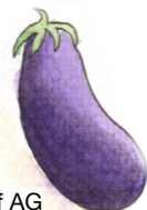
Jos. Pfaff AG Allschwil